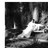
В) «Лунная ночь»